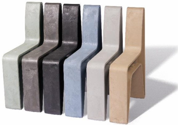
Fig. 3 H-bank modules met rugleuning in de beschikbare kleuren

De bankmodules zijn verkrijgbaar in 6 kleuren: lichtgrijs, neutraalgrijs, donkergrijs, pastelblauw, beige, en olijfgroen.